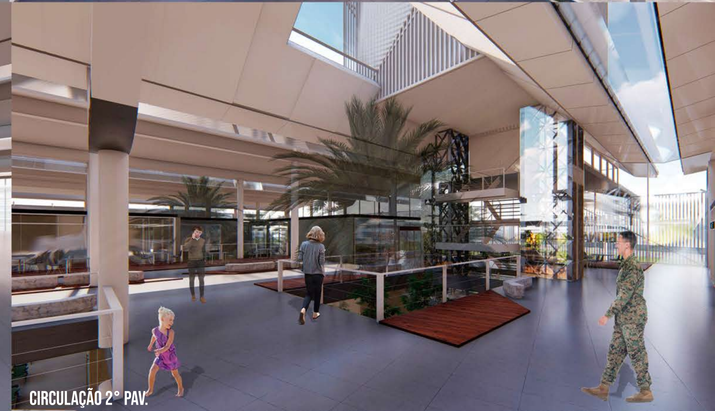
CIRCULAÇÃO 2º PAV.