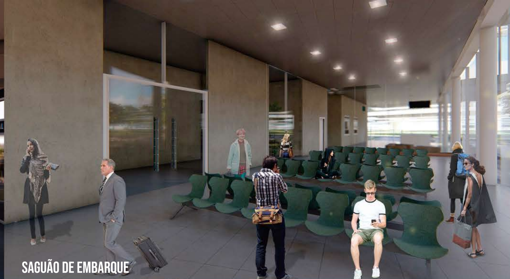
SAGUÃO DE EMBARQUE