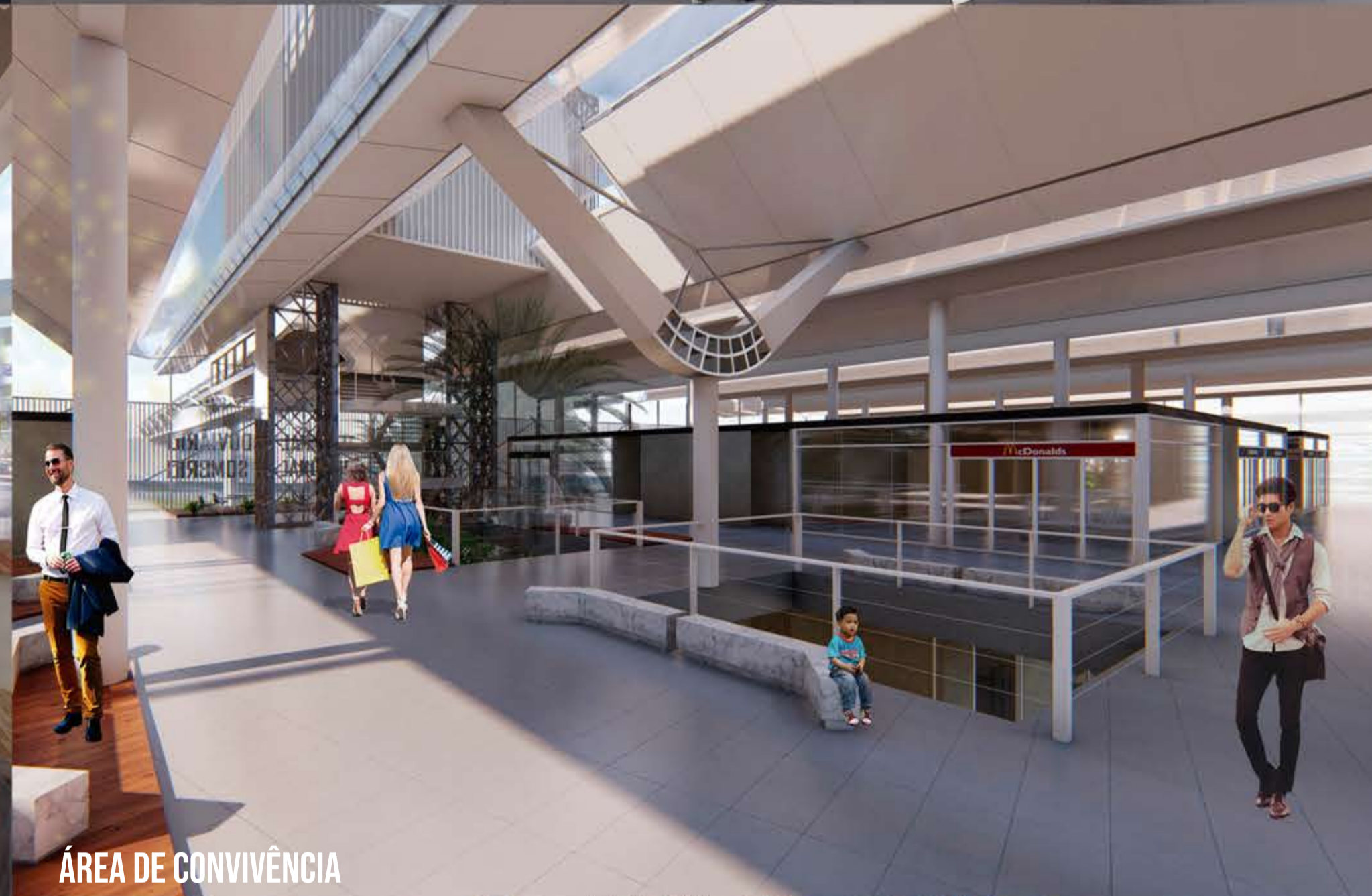
ÁREA DE CONVIVÊNCIA