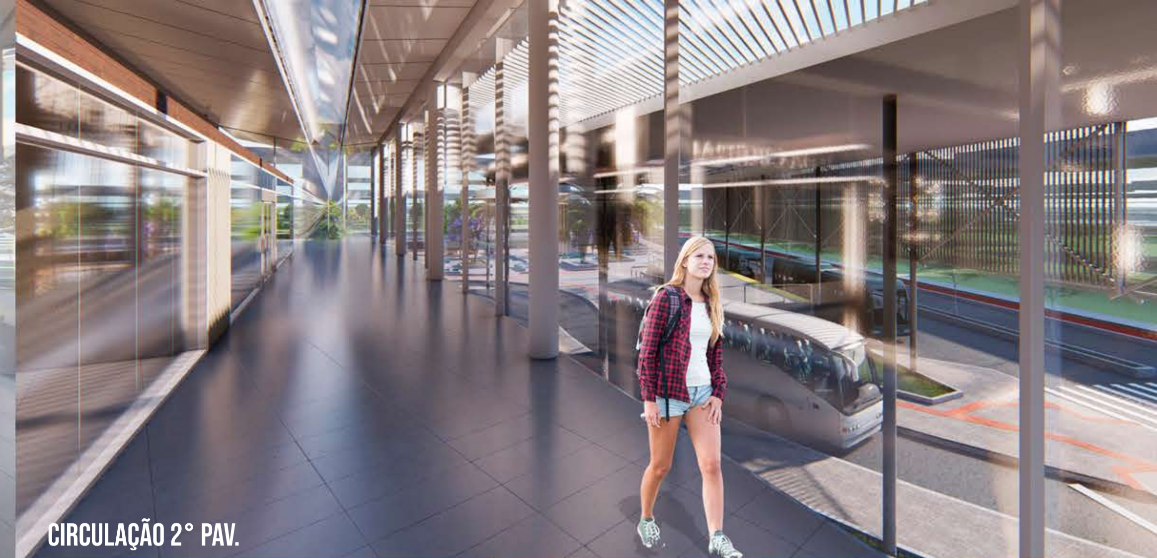
CIRCULAÇÃO 2º PAV.