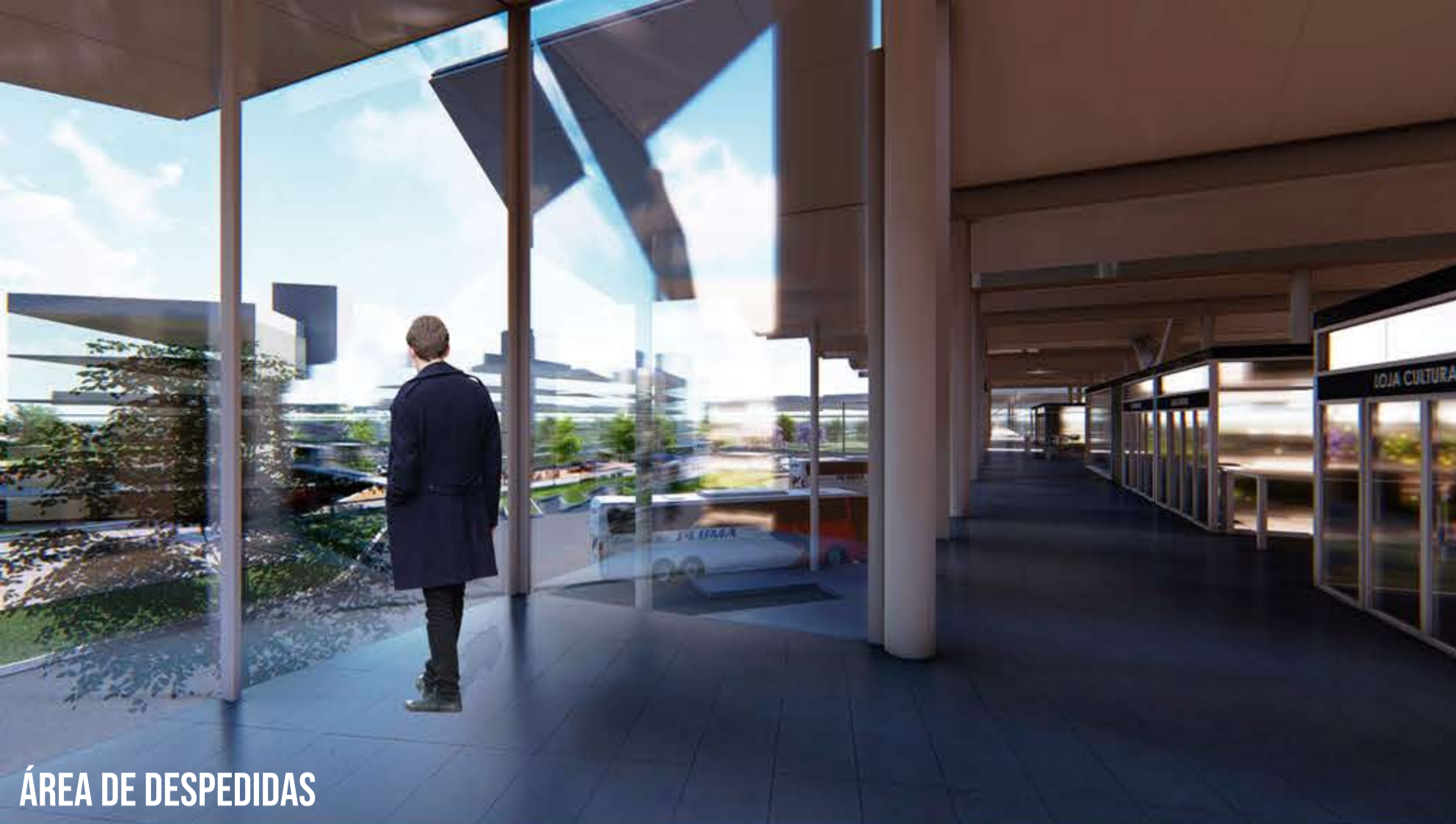
ÁREA DE DESPEDIDAS